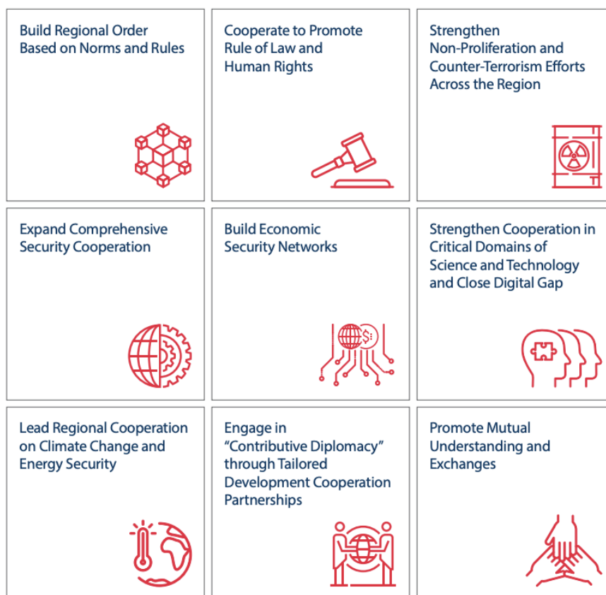
MOFA, Indo-Pacific Strategy: Core Lines of Effort of the Indo-Pacific Strategy of the Republic of Korea

penisola coreana ai processi economici e politici che interessano sia l’Eurasia sia il Sud-Est asiatico. In questa visione, la “ Indo-Pacific Strategy ” 90 si presenta come un contesto di riferimento mediante il quale si intende oltrepassare i vincoli della propria posizione geografica e integrarsi in una più estesa architettura regionale basandosi sui valori di “libertà, pace e prosperità”. L’approccio sudcoreano ha un doppio obiettivo: da un lato, accrescere la resilienza strategica della penisola tramite una migliore integrazione in reti di sicurezza e sviluppo multilaterali; dall’altro, affermarsi come attore responsabile in grado di contribuire alla governance economica, tecnologica ed energetica.